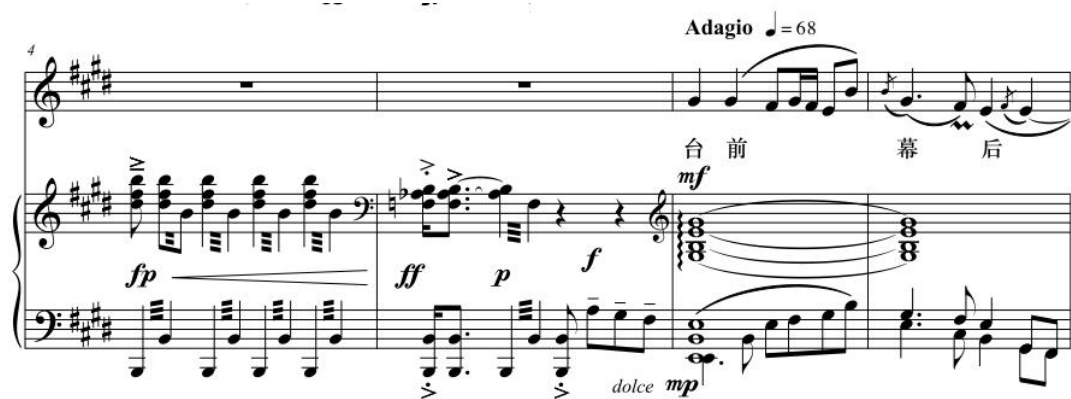
图 3-8 《粉墨春秋》正谱第四小节到第七小节

这首作品中，咬字格外重要，在正确咬字的基础上如何凸显京剧色彩？其中京剧当中的润腔技巧尤为重要。京剧润腔有很多种，包括上倚音、下倚音、复倚音、擞音、波音、颤音等。在《粉墨春秋》这首作品中，倚音技巧运用的最多，其次是波音、颤音润腔方式。第一句“台前幕后”中的“幕”字、“戏里戏外”中的“外”字、“一喜一悲”中的“悲”字、“一瞬休”的“瞬”字等，都是用了倚音的润腔技法，起到不倒字，正字的作用。“生旦净末丑”的“丑”、“一生一世”的“世”字、“锣鼓敲响”的“响”字运用了复倚音的润腔技巧。使得字在旋律中打转，增强情感，具有极强的“京味”。