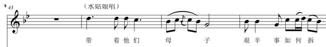
图 3-6 《来生来世把你爱》正谱第四十三到第四十六小节

B 部分，贴近口语化的歌词表达，女子的温婉情感，是水红莲对秦啸生远离危险后的美好祝福。情绪层层递进，充分展现了戏剧的张力。