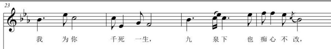
图 3-5 《来生来世把你爱》正谱第二十三到第二十六小节

B 部分，贴近口语化的歌词表达，女子的温婉情感，是水红莲对秦啸生远离危险后的美好祝福。情绪层层递进，充分展现了戏剧的张力。