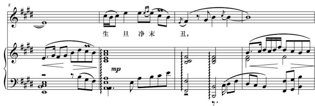
图 3-9 《粉墨春秋》正谱第八小节到第十一小节

其次是波音、颤音技巧。“台前幕后”中的“幕”中的尾音、“生旦净末”中的“末”、“戏里戏外”中的“戏”等都是在咬完字头，字腹中的音上下快速波动形成的。“生旦净末丑”中的“丑”字，后面运用颤音技巧，咬字是慢的、宽的，有悠闲喝茶的细腻、微妙的味道。