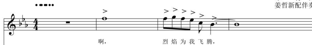
图 3-4 《来生来世把你爱》正谱第一到第四小节

作品的 A 部分展现的是水红莲对爱情无怨无悔的态度，心中充满着忧伤，是女主人公临终前内心的复杂世界，将女子细腻的内心情感宣泄出来，展现丰富柔情的东方女性美的形象，更是内心情感的细腻抒发。