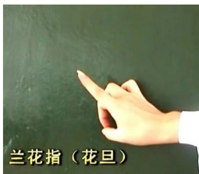
图 3-11 兰花指手型图示

手的造型上，分为：兰花指、兰花掌、赞美指、双指、翘指拳、小五花、缓掌、托掌、双托掌、端掌、按掌、按托掌、拱掌、摊掌等。在这首《俏花旦》作品中我们用到的手上造型是：兰花指、兰花掌、赞美指、翘指拳、缓掌、端掌、按掌、摊掌、右手单指接右手双指、左手单指接右手单指。