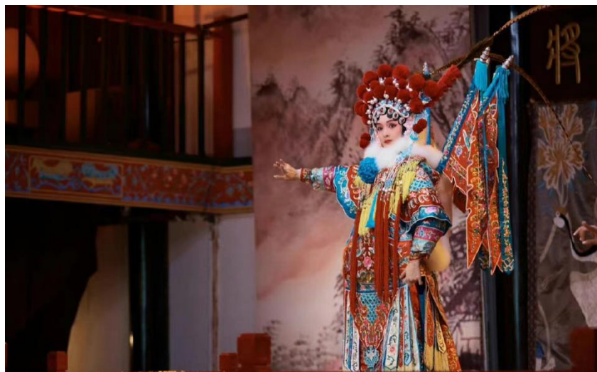
图 3-13 按掌手位图

第二十五小节中“故事里少不了”的“了”字中做摊掌动作。眼神要明亮，眼神随手的移动方向看出去，将小小花旦的精气神发挥到极致，表演的要逼真，进而发挥锦上添花的作用。