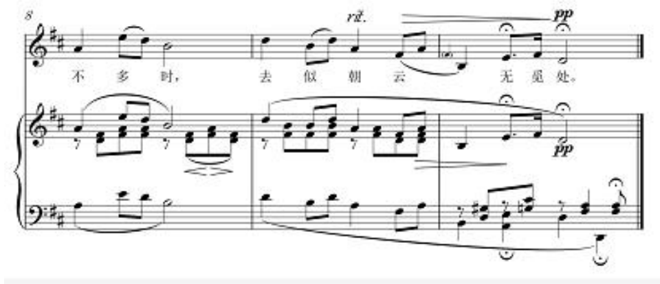
图 3-3 《花非花》正谱第八到第十小节