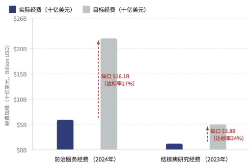
图 1-1 2023 和 2024 年全球结核病防治经费

全球结核病防治存在诸多问题。耐多药结核病（MDR-TB）、广泛耐药结核病（XDR-TB）是目前的公共卫生问题，2024 年全世界大约有 39 万例新的 MDR/RR-TB 病例，但是只有 42% 的病人得到了诊断和治疗 [1] 。资金上 2024 年全球结核病防治服务经费为 59 亿美元，不到 220 亿美元年度目标的 27%；2023 年结核病研究经费为 12 亿美元，只有 2027 年目标 50 亿美元的 1/5 [3] ，如图 1-1 所示。另外，由于疫情造成的医疗服务中断以及资源重新分配，给结核病的诊断和治疗带来了极大的影响，疫情过后影响还没有完全消失 [1] 。