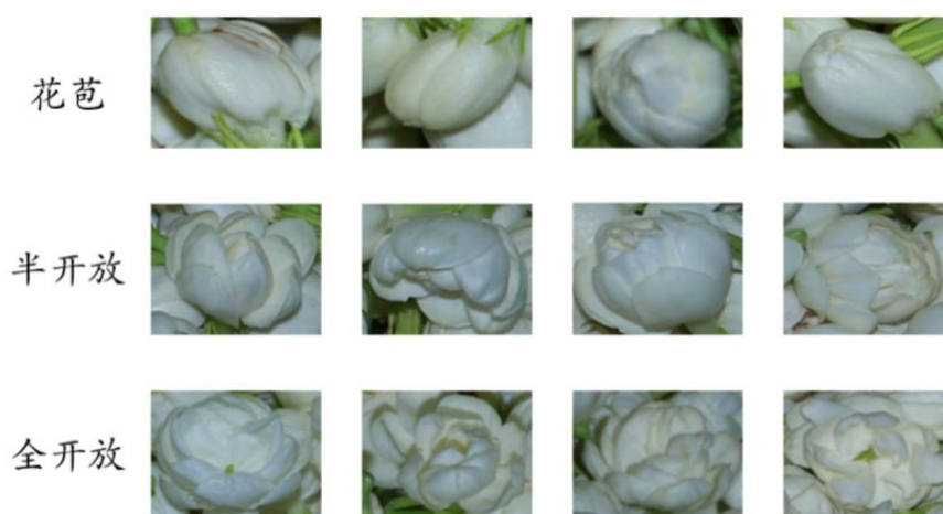
图 1-2 茉莉花不同开放程度

然而，若茉莉花开放不足，香气未能充分释放，窈制后的花茶香气淡薄，难以满足消费者的感官需求；反之，若开放过度，花香已过盛放期，不仅香气减弱，还可能带来苦涩味，影响花茶的整体品质。此外，开放过度的茉莉花在窈制过程中容易产生霉变或腐败，进一步降低产品的安全性。因此，准确判断茉莉花的开放程度，不仅关系到花茶的香气和口感，还直接影响产品的市场竞争力。