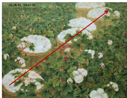
图 1-2 俞致贞《桃满枝棉如云》80cm×110cm 1973年 江都 俞致贞刘力上艺术馆藏