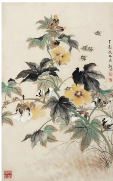
图 1-6 陆抑非《花虫图》1957年

色彩是绘画的主要表现语言之一，画家在创作中根据物象本身的颜色来赋色的色彩观被称为“随类赋彩”，是中国画用色的基本准则。传统绘画中所强调的“类”是主观概念，而“物”是客观存在，类不能脱离物而谈，但类又不是物，这与西方的写实观念有所区别。画家不拘泥于物象表征的颜色，而是对客观物象色彩进行主观的概况处理 ① 。如（图 1-6）中陆抑非把棉花花瓣的颜色概括成鹅黄色，三朵棉花呈三角之势占据画面视觉中心，面积虽小却是点睛之色。棉叶正叶以花青蘸墨，是叶子最浓重的地方，反叶以石绿加汁绿画成点染曙红，用正叶的颜色勾勒叶筋。右下用淡绿色画草，在旁点卧赭石色的地苔。画面整体颜色大气、沉稳、典雅，色彩和谐，展现出色彩的意象性。