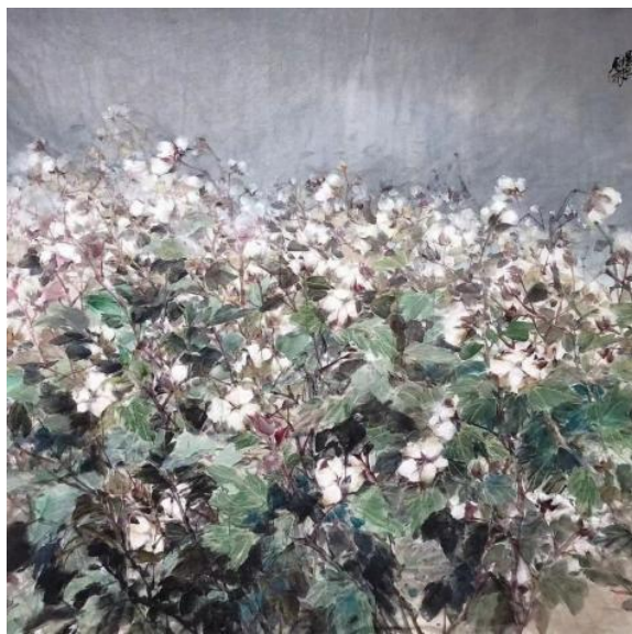
图 1-7 杨星空《暮光之晨》180cm×180cm 2022年

“墨分五色”法则是中国传统花鸟画的另一种法则。可以理解为一种用笔墨技法来表现中国画意象的色彩。老子曾道“无色而色始全”，这种无为的思想，让中国画将水与墨的调和做到了极致，用意境来弥补形的不足，形成自然、素雅的风貌。当代花鸟画的色彩观念受西方色彩学的影响，考虑环境色，固有色等方面在画中的作用。如（图 1-7）杨星空用灰色作为背景，衬托出前景的棉花，以至于棉花的白叶渲染到背景色上了，在上层的棉花是植物的固有色，下层的棉花则受光影的影响染成了黑色。