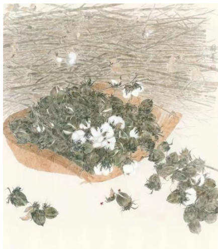
图 1-4 诸乐三 《棉丛图》1973 年