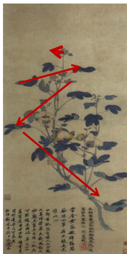
图 1-1 明代 孙艾 《木棉图》 65.7cm×29.4cm 北京 故宫博物院

从画作的尺寸上来说，当代花鸟画作品为了在美术馆等大的公共空间中达到更好的展览效果增大了作品画幅。而大尺幅的作品，打破了传统折枝花鸟画的局限，影响画面内容的构成，画面组成的视角也与传统花鸟画有所区别。逐渐从对棉花的局部描绘转向对棉花生长环境的场景展现，注重画面的气象、情节和空间的整体关照。李天逸的《棉花》一图，构图上饱满灵动，丰富了色彩的张力和视觉感官的冲击力。如当代青年画家杨星空所画的《丰收》、《天山雪》、《暮光之晨》，都是用全景式构图展现棉花丰收的盛大场面，画面从（图 1-3）主体物棉花上以大观小，注重写实。简约的背景可当作留白，画面的重点落在中心位置，大繁大简的处理方式增强了画面的对比效果，在视觉上给人强烈的冲击力。