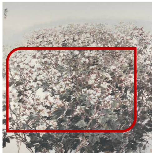
图 1-3 杨星空《丰收》200cm×200cm 2021年 纸本设色

其他棉花题材相关绘画作品如刘增祺的《新疆棉花颂》、柳文喜的《新疆棉花洁白无瑕》、张海洋的《戈壁金光染玉棉》等也是用大场景和肆意的笔墨展现了新疆棉花宏大的丰收场面。还有同是满构图但以人物为主，棉花为衬景出现的绘画作品，如蒋兆和的《采棉姑娘》、阎真的人物画《银海峰》、闫玉臣的《棉花姑娘》等。