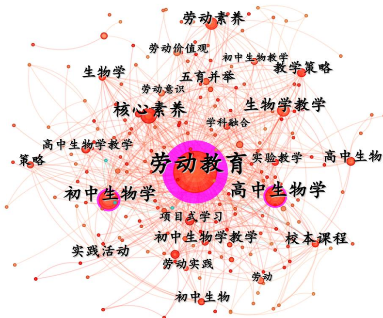
图 1-2 生物学教学与劳动教育融合研究高频关键词共现网络 Figure 1-2 High-frequency keyword co-occurrence network of research on integration of biology teaching and labor education

图 1-2 的高频关键词共现网络进一步印证了上述结构。中心位置的“劳动素养”“生物学教学”“核心素养”“学科融合”等节点，表明该领域的研究始终围绕“五育并举”与“核心素养”的政策导向展开。“项目式学习”作为连接“生物学教学”与“劳动教育”的关键节点，在网络中具有较高的中介中心性，说明研究者已意识到